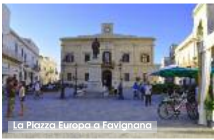
La Piazza Europa a Favignana

«Le bombe non scelgono. Colpiscono qualunque cosa» disse un tempo Nikita Chrušëv, noto leader dell'Unione Sovietica. Il 6 maggio 1943 le bombe colpirono anche l'isola di Favignana. Domenica, infatti, con inizio alle ore 9.30, in piazza Europa a Favignana, si svolgerà la cerimonia di commemorazione del 75 anniversario del bombardamento aereo ad opera degli anglo-americani. L'attacco causò una strage vera e propria tra i civili, con un bilancio di 101 favignanesi morti, tra cui molti bambini e ragazzi.